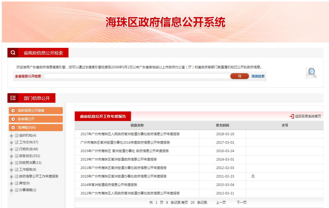
图 1：海珠区政府信息公开系统官洲街道办事处信息公开目录