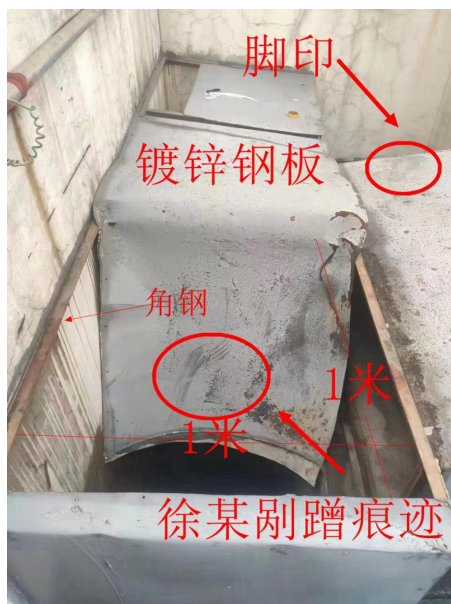
图 4 坠落洞口

(3) 勘查时，受损风管已修复并做好禁止踩踏的警示标记。事发现场风管镀锌钢板塌陷洞口尺寸约 1000mm × 1000mm，钢板未见明显撕裂断开，铆接孔完好，风管中间及四周加固角钢未出现明显变形情况，洞口东侧和南侧铁皮上各发现 1 枚足迹（详见图 4）。