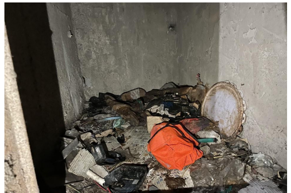
图 3 电梯前室加压送风井内部情况