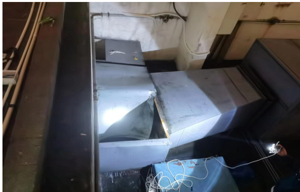
图 2 镀锌钢板风管段破损情况