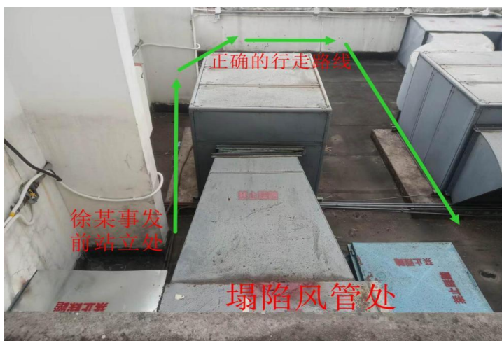
图 5 事故现场位置图

专家组根据勘查分析，推断事故经过为：徐*福在事发时从地上爬上风管连接处角钢后有跳跃到塌陷处送风管的行为，因送风管铆接处无法承受徐*福骤然落在风管面的冲击力使得钢板从铆钉脱出导致风管发生塌陷，造成徐*福坠落在风井内（详见图 5、图 6）。